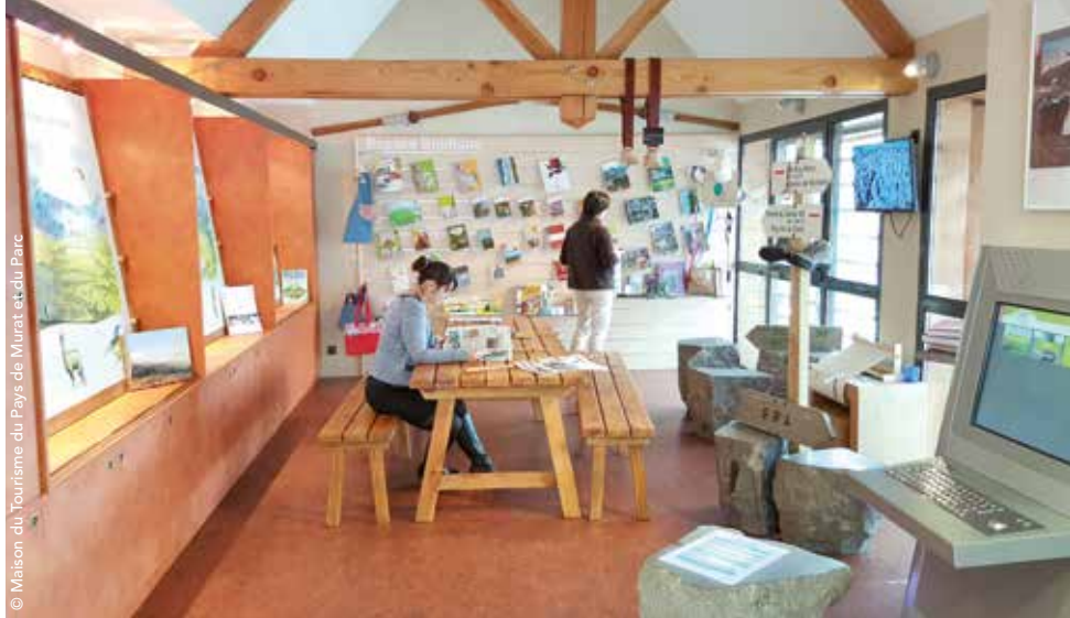
© Maison du Tourisme du Pays de Murat et du Parc